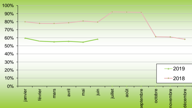
% usagers respectant la vitesse réglementaire