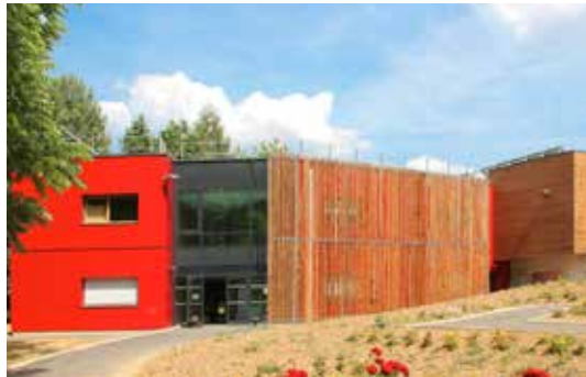
Pointel, internat pour la Maison familiale rurale Maître d'ouvrage : MFR de Pointel Maître d'œuvre : Gil Dauchez, Thierry Chalaux, architectes