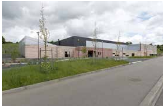
Gacé, halle des sports Maître d'ouvrage : CDC de la Région de Gacé Maître d'œuvre : Bernard et Thouin architectes