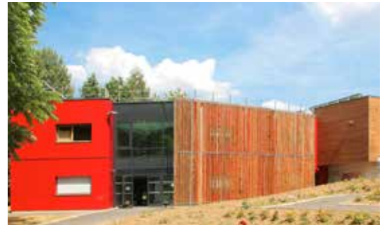
Pointel, internat pour la Maison familiale rurale Maître d'ouvrage : MFR de Pointel Maître d'œuvre : Gil Dauchez, Thierry Chalaux, architectes