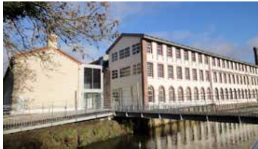
St-Sulpice-sur-Risle, manufacture Bohin Maître d'ouvrage : EPF Normandie / CDC du Pays de l'Aigle Maître d'œuvre : Jean-Marie Mandon architecte