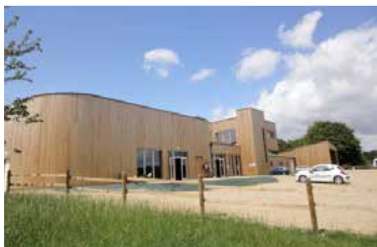
Le Theil-sur-Huisne, cidrerie traditionnelle du Perche

Maître d'ouvrage : Privé Maître d'œuvre : Pierre CHAUVEL, architecte (SICA)