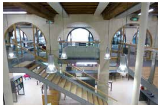
Mortagne-au-Perche, médiathèque Maître d'ouvrage : Ville de Mortagne-au-Perche Maître d'œuvre : Agence Archi-Triad