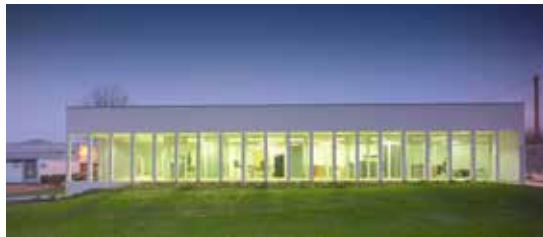
Alençon, administration du lycée Mézen Maître d'ouvrage : Conseil régional de Basse-Normandie Maître d'œuvre : ACAU, architectes