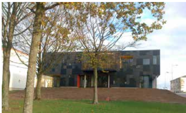
Flers, pôle services «Modus» Maître d'ouvrage : Communauté d'agglomération du Pays de Flers Maître d'œuvre : Gil Dauchez, Thierry Chaloux, architectes