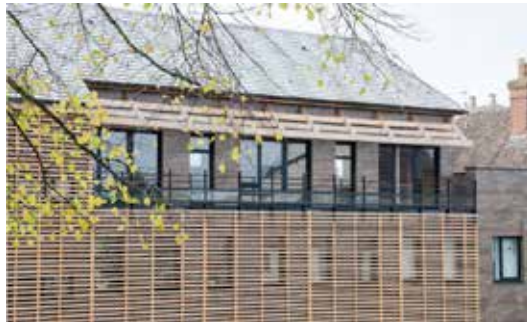
L'Aigle, pôle santé Maître d'ouvrage : CDC du Pays de l'Aigle et de la Marche Maître d'œuvre : Hubert Masson, architecte