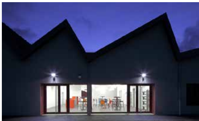
Alençon, maison de la vie associative Maître d'ouvrage : ville d'Alençon Maître d'œuvre : Jean-François Chavois, architecte