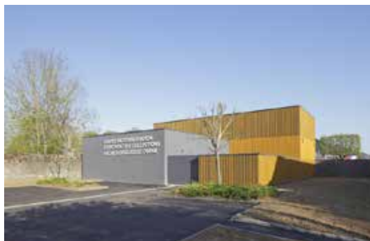
Alençon, centre de conservation et d'études des collections archéologiques de l'Orne

Maître d'ouvrage : Conseil départemental de l'Orne Maître d'œuvre : Jean-François Chavois, architecte © PatrickHMüller