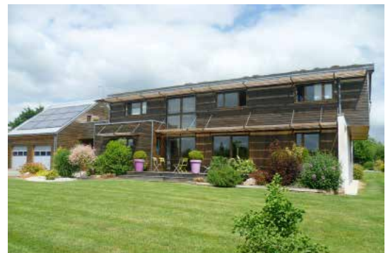
Condé-sur-Sarthe, maison Maître d'ouvrage : privé Maître d'œuvre : Pascal Sevrin, architecte