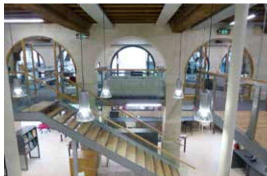
Mortagne-au-Perche, médiathèque Maître d'ouvrage : Ville de Mortagne-au-Perche Maître d'œuvre : Agence Archi-Triad