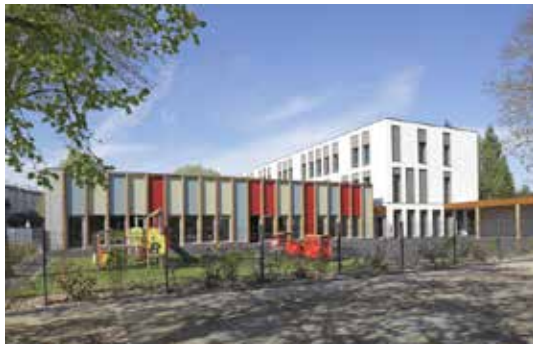
Alençon, école du Point du Jour Maître d'ouvrage : Ville d'Alençon Maître d'œuvre : Atelier Philippe Challes