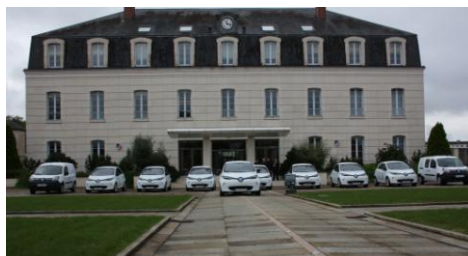
En 2016, le Conseil départemental de l'Orne double sa flotte de véhicules électriques

Dans le cadre de sa politique de développement durable, le Conseil départemental poursuit sa démarche d'acquisition de véhicules « propres ». Cette année, alors que va débuter l'implantation de bornes de recharge publiques par le Syndicat de l'Énergie de l'Orne (Se61) – avec le soutien financier du Conseil départemental – la flotte de véhicules électriques du Département va doubler.