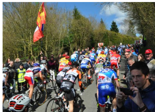
33 000 € du Conseil départemental de l'Orne pour l'édition 2016 de la course Paris-Camembert