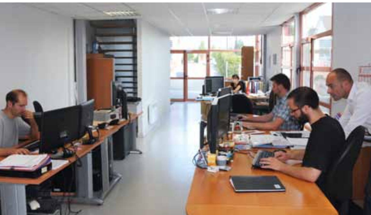
L'innovation est partout : dans les matériaux (ici chez Carl) comme dans les services. Partout, à travers le département, l'Orne innove.