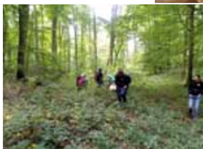
La forêt de Bellême est célèbre pour les multiples variétés de champignons que recèlent ses sous-bois à l'automne.