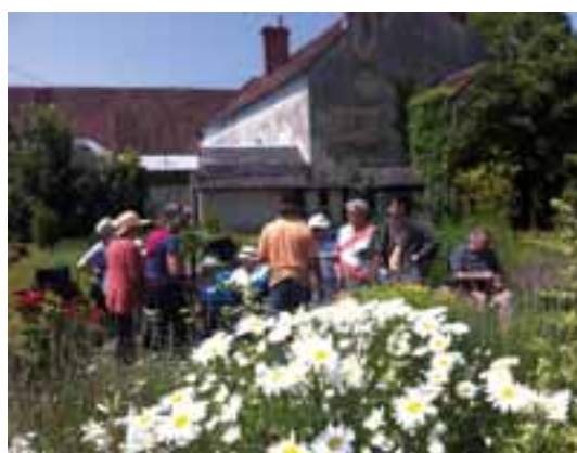
À Sées, l'accueil de jour dispose de locaux autonomes à l'hôpital et organise des sorties avec malades et aidants : visites de jardins, cinéma, restaurant...