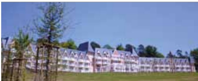
Le B'O Cottage, quatre étoiles de B'O Resort, a été inauguré le 4 juin dernier.