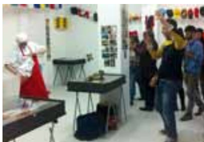
À Alençon, dans le quartier de Courteille, les Bains Douches sont devenus un véritable bassin d'art contemporain.

Les « cibles » d'Ivan Fayard y avaient pris leur quartier cet été, remplacées depuis la rentrée, par les installations de Samir Mougas (1) . À Alençon, dans le quartier de Courteille, les Bains Douches sont devenus un véritable bassin d'art contemporain. Depuis 2011, une équipe de passionnés a investi les lieux, transformés en ateliers et galerie d'art. Les artistes s'y succèdent