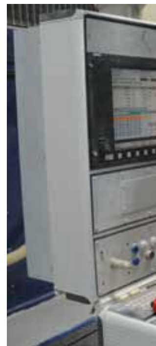
Dans les locaux de Carl, à Alençon, la con