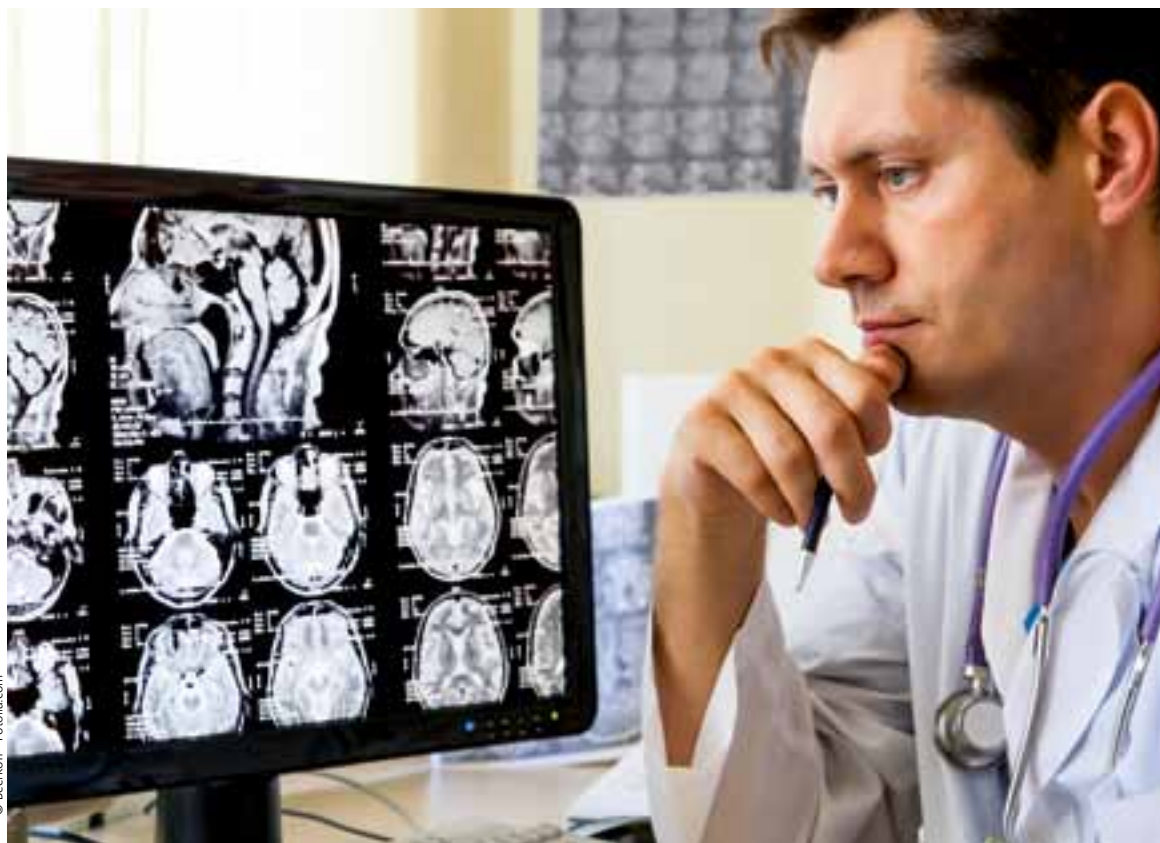
Le Plan prévoit de raccorder à la fibre optique 89 sites stratégiques du département, notamment dans les secteurs de l'économie et de la santé.

Le Plan numérique ornaïs (PNO), adopté par le Conseil général avant l'été, lancera ses premiers chantiers au premier semestre 2014. Une priorité : raccorder en fibre optique 89 sites stratégiques (notamment économiques) d'ici 2020, en plus d'une montée en débit pour 12% des Ornaïs.