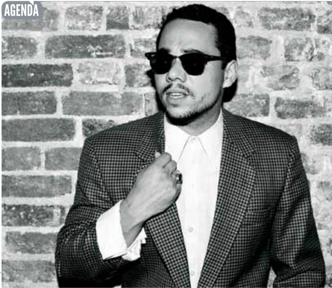
Ben l'Oncle Soul and Monophonics.