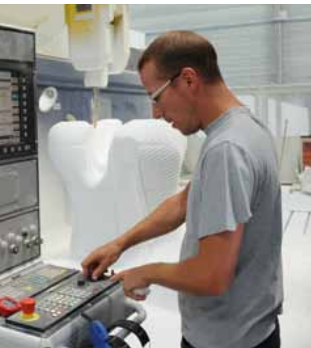
ception et la fabrication d'éléments composites de haute performance est permanente.