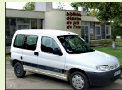
La navette de réservations.

Les bibliothèques changent leurs fonds environ quatre fois dans l'année. Au moins une fois au cours de cette rotation, les responsables des bibliothèques viennent repérer et renouveler leurs fonds auprès de la Médiathèque départementale à Alençon. Un nouveau service de réservations a vu le jour : la navette de réservations. Ce service vise à répondre rapidement aux demandes de réservation des dépositaires en réduisant le délai d'attente entre deux passages de bibliobus. La navette est un véhicule utilitaire léger. Elle ne transporte que des réservations. Elle n'est donc pas un bibliobus. Ce dernier est consacré aux renouvellements de fonds.